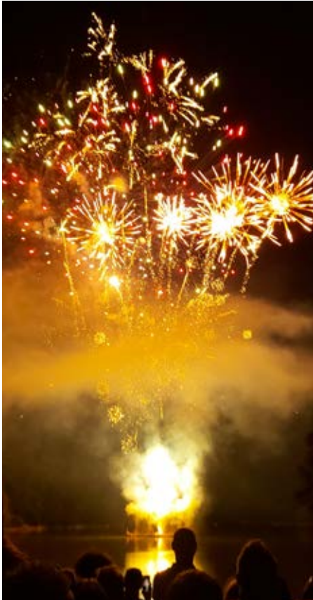
13 juillet Spectacle pyrotechnique