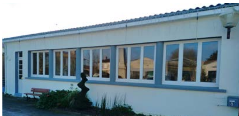
Façade de la cantine

Les murs extérieurs de la cantine ceux du cabinet d'ostéopathe et du kinésithérapeute ont eux aussi subi un ravalement.