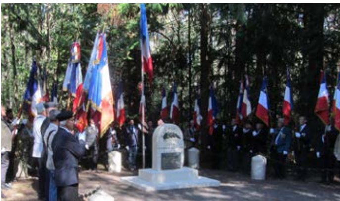
28 août Commémoration à la Stèle des Martyrs