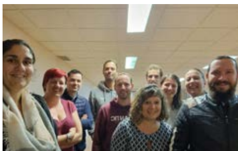
Bureau du CPE