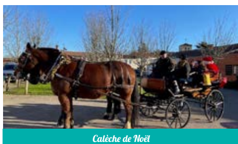
Calèche de Noël

L'année 2022 a permis à l'ensemble des citoyens de pouvoir revivre, se retrouver dans des moments de fête et de convivialité.