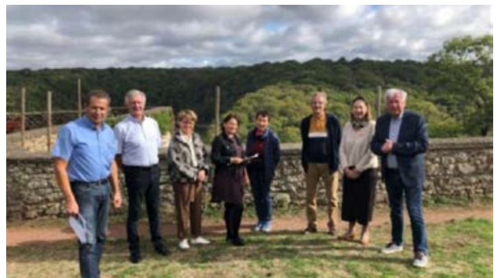
3 octobre Signature convention Fondation patrimoine