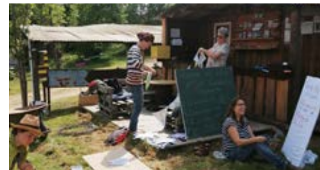
Bénévoles de Perrure en fête

Collège solidaire Perrure en fête 02 51 00 25 07 – fete@grandeperrure.fr Très belles fêtes de fin d'année à tous.