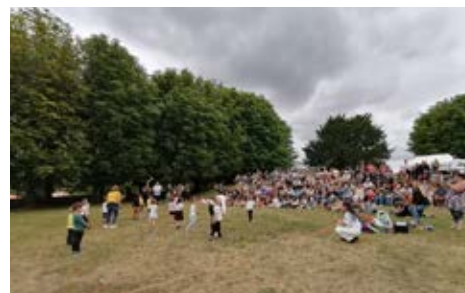
Danse des maternelles lors de la fête de l'école

Nous serions très heureux de vous voir participer aux diverses manifestations qui vont être organisées accompagnés de vos familles, proches et amis... et partager ensemble des moments de bonheur et de convivialité dont la seule finalité est le bien-être de nos enfants à l'école.