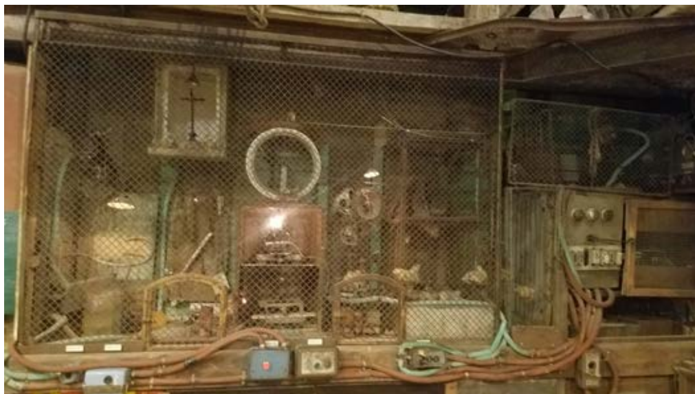
Les machines de Robert pour faire parler les pierres

Les élèves de CM1-CM2 pour l'école Maro Vidua