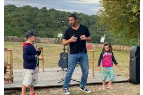
10 août Spectacle fantastique