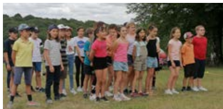
Chants des CE2 - CM lors de la Fête de l'école du 26 juin

L'an dernier, nous avons organisé un repas champêtre (jambon à la broche/moquette) qui a remporté un grand succès. Nous espérons renouveler cet événement cette année. Ce repas sera ouvert à tous les Merventais.