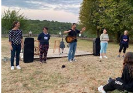
20 juillet Spectacle fantastique