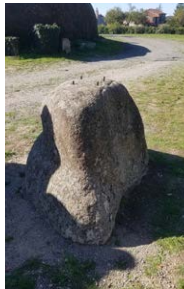
Le nombril du monde