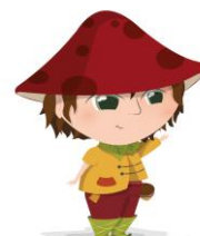
Écho , la nouvelle mascotte

De nouveaux aménagements sont également attendus avec la création d'une nouvelle terrasse et d'un comptoir mange-debout panoramique au Bar-Snack du voltigeur ou encore la fabrication de poubelles « écoresponsables » équipées d'hôtels à insectes. Le parc propose une nouvelle offre s'adaptant aux budgets et aux envies de chaque visiteur. Il sera désormais possible de choisir entre 2 forfaits : le Pass Aventurier donnant un accès illimité sur l'ensemble des activités (sauf extras) et le Pass Explorateur donnant accès à la plaine de jeux et au Petit Train sur rail. Cette dernière offre permet également de circuler librement sur l'ensemble du parc et d'avoir la chance de rencontrer Écho, le lutin de la Vallée !