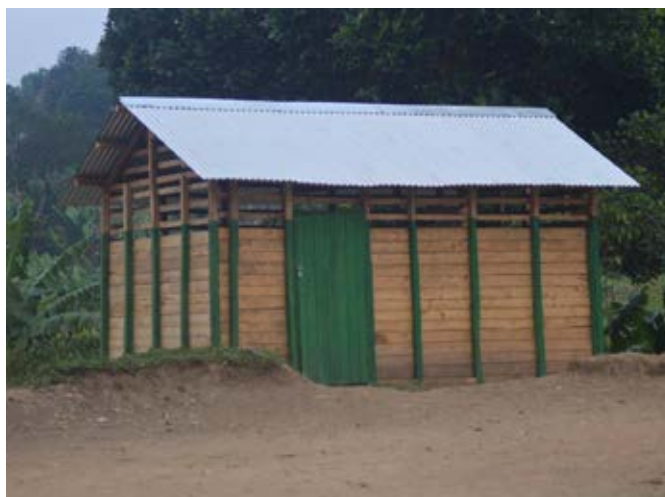
« Cantine construite pour l'école de Sahofika »

Et surtout un grand merci aux enfants de l'école Maro Vidua pour leur implication dans ce projet !! Misaotra (merci) !