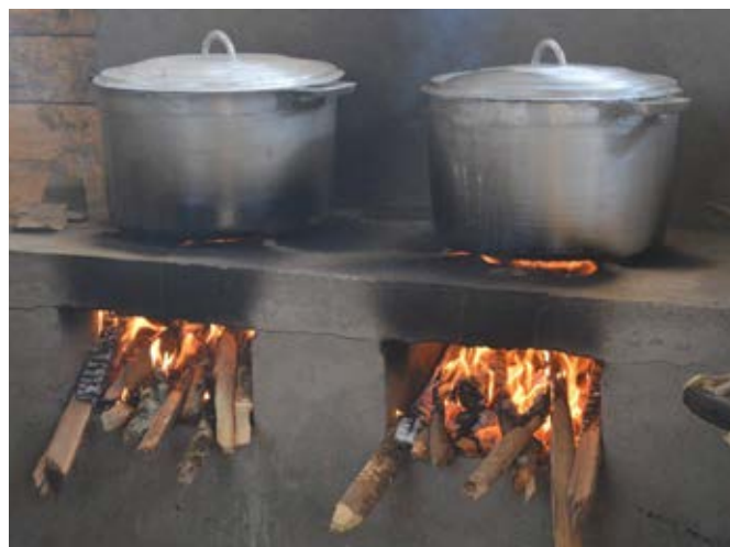
« Fourneaux de la cantine »