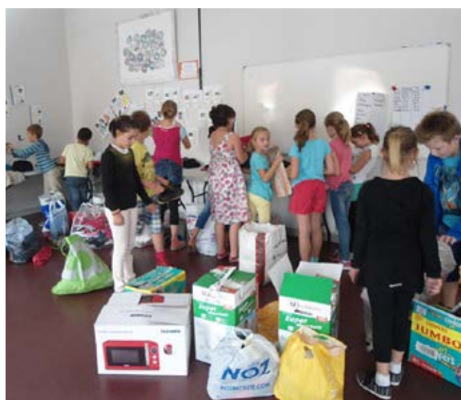
« Collecte de vêtements à l'école Maro Vidua – Mervent »