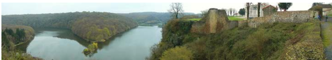
Nettoyage des coteaux des remparts, plusieurs matinées d'avril à juillet

L'association remercie les bénévoles, la Municipalité, les Merventais et le public. 2017 sera dans la continuité des actions engagées avec des prochains rendez-vous.