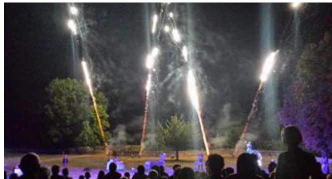
17 août 2016 : Spectacle nocturne « Entre Aquitaine et Angleterre avec les Allumeurs d'étoiles ».