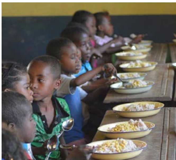
« Premier repas servi à la cantine »